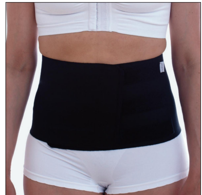
ViraRak 20 cm, 50231