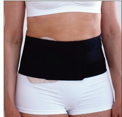
ViraRak 15 cm, 50230