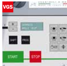
Visualizzatore gradi angolo di taglio Cutting angle display