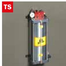
Dispositivo taglio a secco Dry cooling device