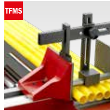
Taglio fascio meccanico Mechanical bundle clamping device