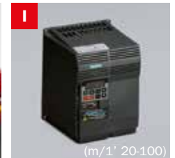
Inverter Frequency converter