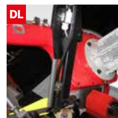
Dispositivo controllo deviazione lama Blade deflection control device