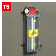
Dispositivo taglio a secco Dry cooling device