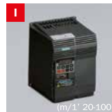
Inverter Frequency converter