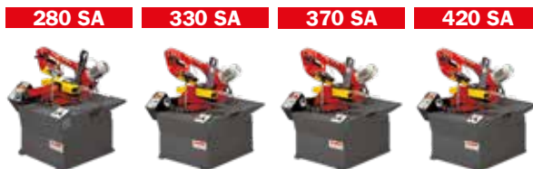
Pannello Alto Control panel

Birkegårdsvej 2 · 7400 Herning · Denmark · Phone +45 97 11 92 22 · www.sandfeld.com