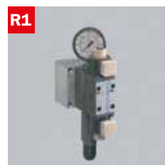
Reg. pressione morse Adjustable vice pressure