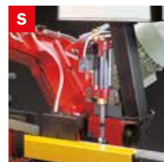
Skip elettrico Electrical skip