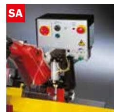
Discesa controllata Gravity down feed