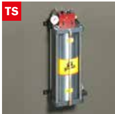
Dispositivo taglio a secco Dry cooling device