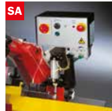
Discesa controllata Gravity down feed