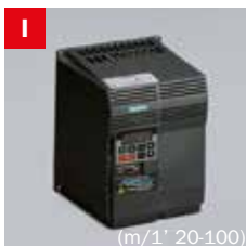
Inverter Frequency converter