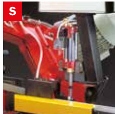
Skip elettrico Electrical skip