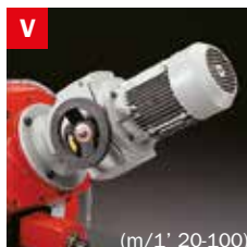
Motovariatore Blade speed variator