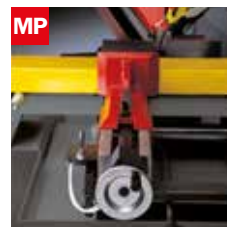
Morsa pneumatica Pneumatic vice