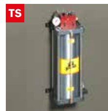
Dispositivo taglio a secco Dry cooling device