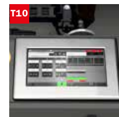
Touch screen 10" (solo per versione TOUCH) 10" touch screen (only for TOUCH mod.)