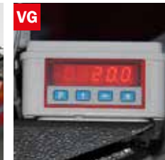
Visualizzatore gradi angolo di taglio Cutting angle display