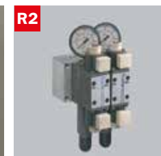
Reg. pressione morse doppio Adjustable vice pressure