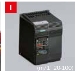
Inverter Frequency converter