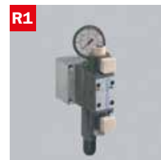
Reg. pressione morse Adjustable vice pressure