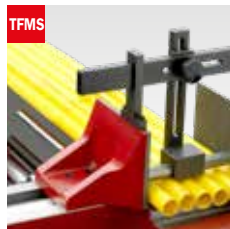
Taglio fascio meccanico Mechanical bundle clamping device

Semiautomatic band saw machine with bow and vice movement at hydraulic control, automatic fast up/down bow movement controlled by feeler pin and cutting progress with infinitesimal adjustment. Double safety button for cycle start and low voltage electrical system according to EC rules. The machine can be equipped with roller tracks and related accessories.