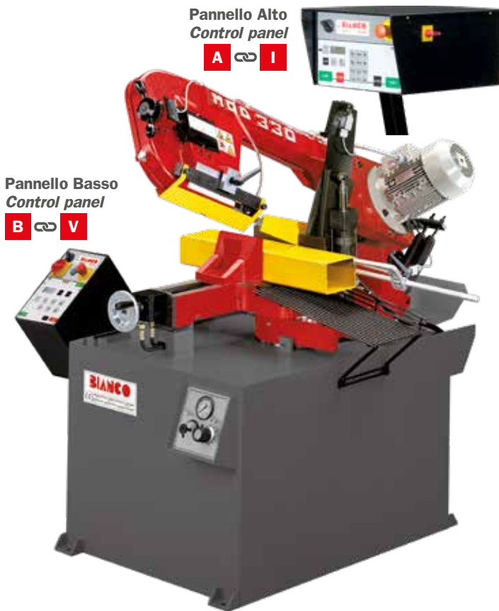
Pannello Alto Control panel