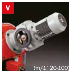
Motovariatore Blade speed variator