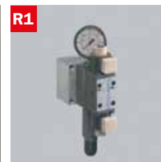
Reg. pressione morsa Adjustable vice pressure