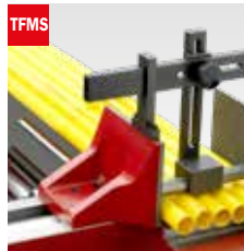
Taglio fascio meccanico Mechanical bundle clamping device