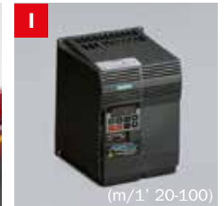
Inverter Frequency converter