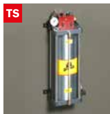
Dispositivo taglio a secco Dry cooling device