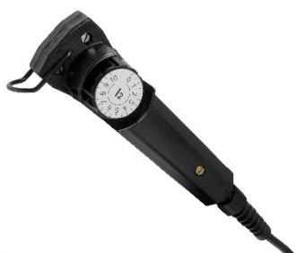
MMA 3 traditionel fjernbetjening til strømstyrkeregulering