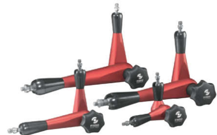
Strato \mu -Line-Mess-Stativ 4.500-4.800