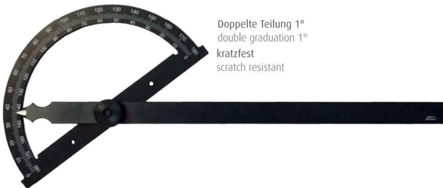
Doppelte Teilung 1° double graduation 1° kratzfest scratch resistant