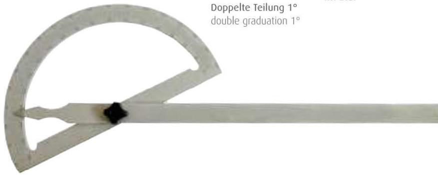
Doppelte Teilung 1° double graduation 1°