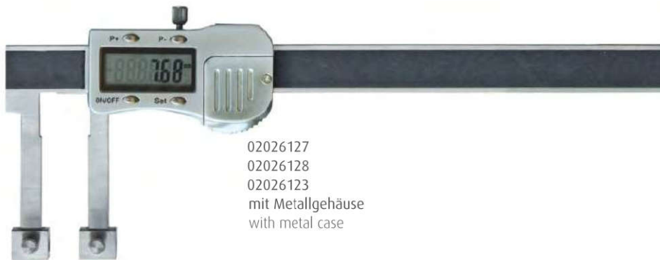
02026127 02026128 02026123 mit Metallgehäuse with metal case