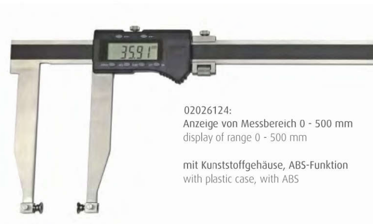
02026124: Anzeige von Messbereich 0 - 500 mm display of range 0 - 500 mm mit Kunststoffgehäuse, ABS-Funktion with plastic case, with ABS