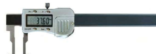
02026063 150 mm Metallgehäuse, RB5 metal-casing, RB5