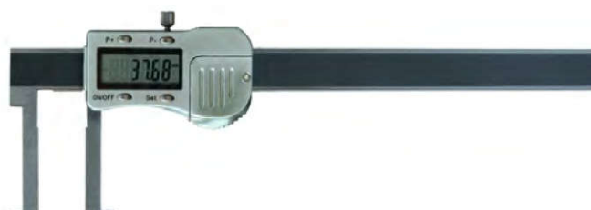
02026050 02026058 170 mm und 300 mm Metallgehäuse, RB5 metal-casing, RB5