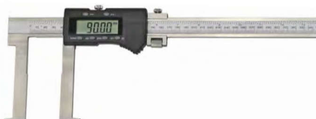
02026059 500 mm Kunststoffgehäuse, ABS plastic-casing, ABS