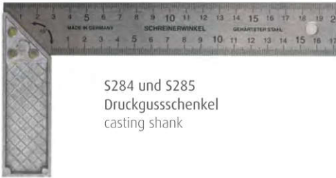
S284 und S285 Druckgusschenkel casting shank

Art.-Nr. S 284 mm/inch mit 32 mm breitem Blatt, blanke Platte gehärtet, 4 Maße 1. Seite mm/mm 2. Seite inch/inch