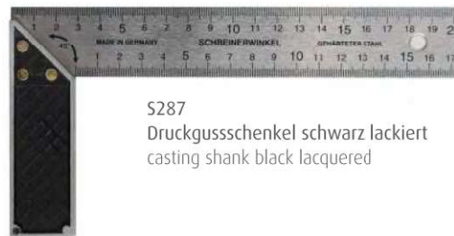
S287 Druckgusschenkel schwarz lackiert casting shank black lacquered

Art.-No. S 285 mm/mm with 32 mm stock blade hardened, one side mm/mm