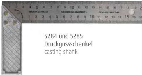
S284 und S285 Druckgusschenkel casting shank

Art.-Nr. S 284 mm/inch mit 32 mm breitem Blatt, blanke Platte gehärtet, 4 Maße 1. Seite mm/mm 2. Seite inch/inch