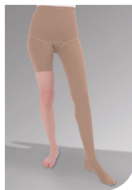
AG-HT Et ben med buxsedel