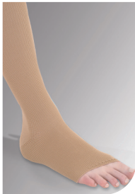
Skrå afslutning uden tå*