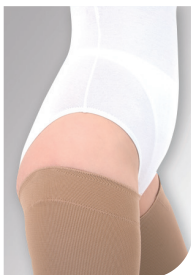
Slipform (højere yderside)