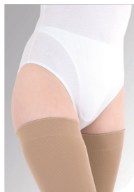
Silikone dupper, indvendig