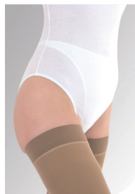
Silikone dupper og Mikrodupper til sensitiv hud, i forlængelse