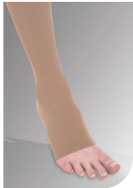
Lige afslutning uden tå*