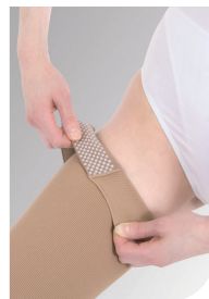
3/4 Silikone dupper indvendig

Bredde på båndet med silikone dupper: 2,5 cm eller 5,0 cm.