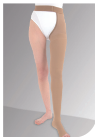
AG-T Lårstrømpe med hoftedel og taljebånd