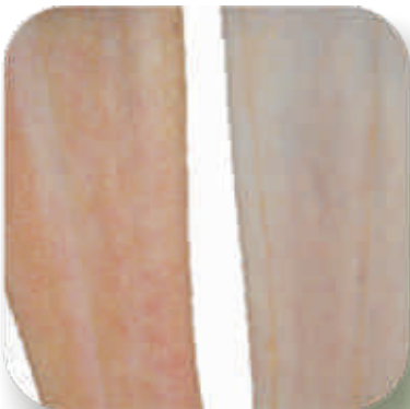
Illustration af hhv. dårligt rensat og godt rensat læderside.

The solution is, besides good fleshing, drumming on the leather side, 8-10 minutes in DT68 Leather Cleaner.