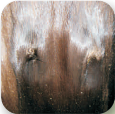
Illustration af skind med fedtudtræk

Fedtudtræk er den hyppigst forekomne fejl på minkskind. Fejlen medfører katastrofale store økonomiske tab for minkavlere.