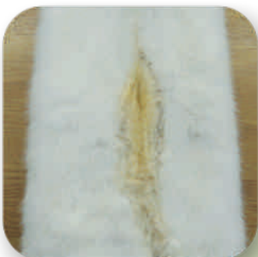
Illustration af dårligt rensat skind.

After having removed the sleeve bags from the pelting process, cleaning of the leather side is more important than ever before.