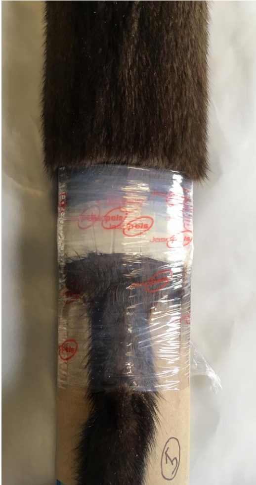
HG 5 tanelinje...