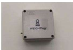
WeightLog gateway typisk 1 stk. pr. farm