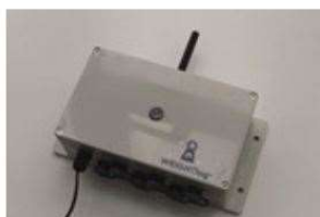
WeightLog vejecomputer til 6 stk. vejehylder

Bindingsperioden for WeightLog og dermed årlig licens og support er 3 år. Support og licens kan afregnes årligt eller kvartalsvis (v. kvartalsvis opkræves et gebyr på 150 kr./faktura). Prisen for udstyr kan leases over 3 eller 4 år v. køb af udstyr over 50.000 kr. Hedensted Gruppen A/S, giver 1 års garanti på alt udstyr.