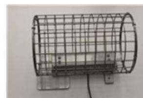
WeightLog vejehylde 1 stk. pr. bur rum