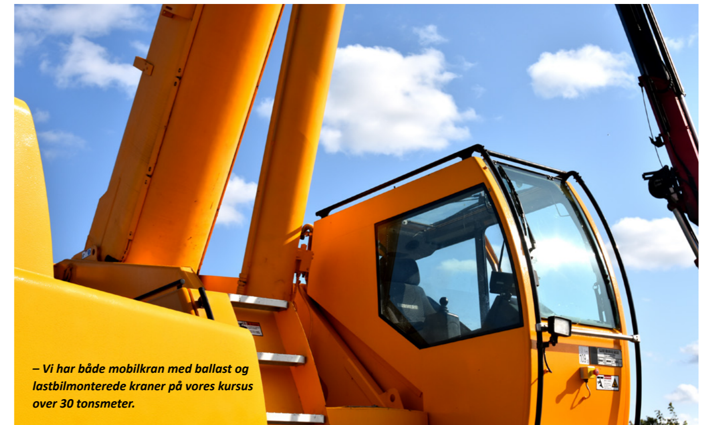
– Vi har både mobilkran med ballast og lastbilmonterede kraner på vores kursus over 30 tonsmeter.

Uddannelsessted: AMU Nordjylland, Sofievej 61, 9000 Aalborg.