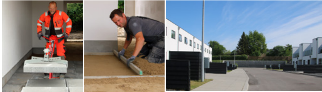
Belægning ved boliger i Gug

Som anlægsstruktør er du ekspert i kloak og belægning. Du arbejder derfor oftest op til og med soklen på bygningsværker.