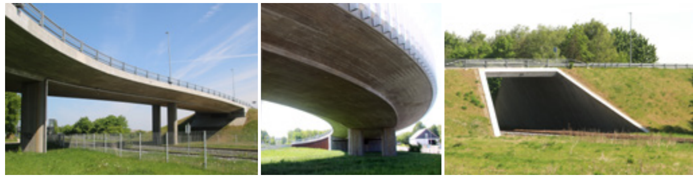
Bro over banelegeme, Svenstrup