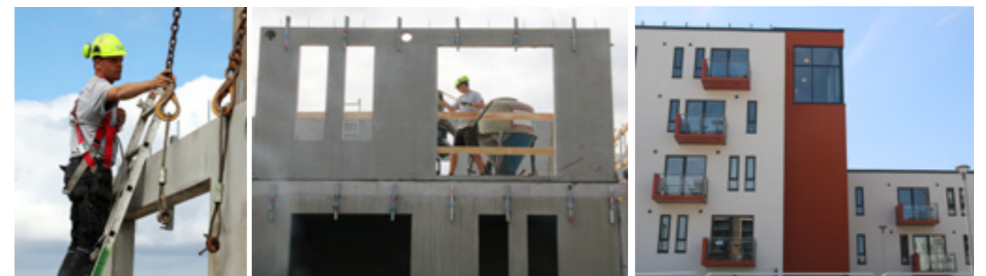
Boliger på Eternitten, Aalborg

Igennem din uddannelse får du også kompetencer inden for rør læggerarbejde.