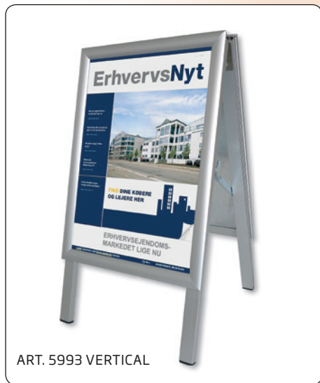
ART. 5993 VERTICAL

🇬🇧 Non-corrosive pavement board with anodized aluminum snap frames. 25 mm profile with corners cut in mitred. Back panels in galvanized steel. Front panels in anti reflex APET. Legs in 15 x 30 mm aluminum square tube. Weight: 2 kg.