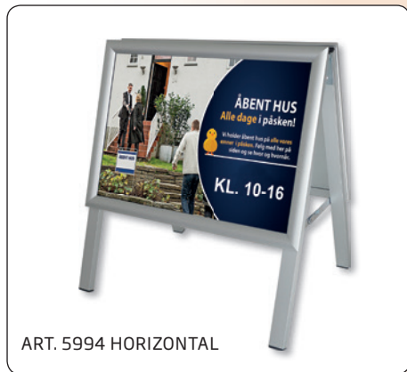
ART. 5994 HORIZONTAL