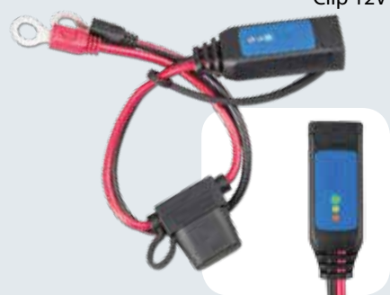
batteri indikator M8-ringklemmer