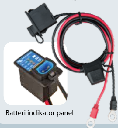
Batteri indikator panel